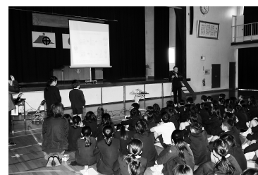
錦江台小学校での講座の様子

認知症サポーターとは、認知症を理解し認知症の人や介護する家族をできる範囲で手助けする応援者です。認知症は、歳を重ねると誰でもなりうる病気です。子供たちには正しい知識と接し方を早い段階で習得してもらい、地域で暮らす認知症の方の理解者として、支え手の一翼を担う存在に育って欲しいと考えています。