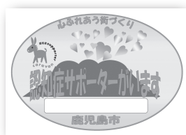
A4サイズ・ラミネート

講座終了後は、認知症サポーターが在籍している事を示す「認知症サポーターステッカー」を申請できます。ステッカーはおもに教室や学校入口等に掲示されています。費用無料で2枚まで申請できます。